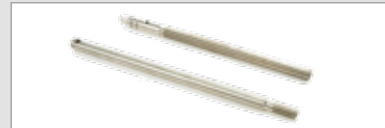
Spindel | Schubstange